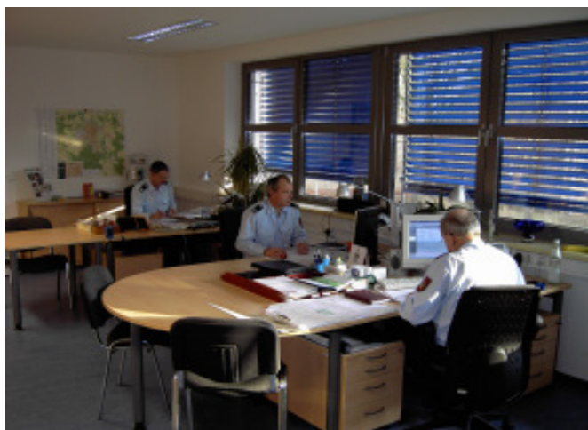
Abteilung Vorbeugender Brandschutz

Ein weiterer Schwerpunkt war die Vorbereitung der Fusion der Städte Dessau und Rosslau. Hier war und ist es u.a. notwendig, die vorhandenen Schwerpunktobjekte und Brandmeldeanlagen zu erfassen und eine einheitliche Alarmierung abzustimmen.