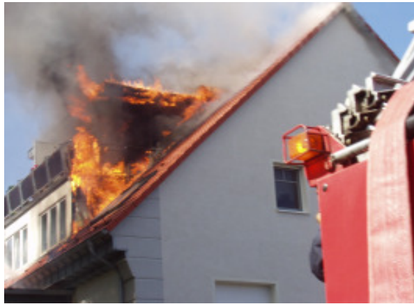
Situation zu Einsatzbeginn