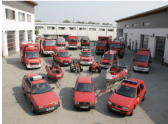
Fahrzeuge der Berufsfeuerwehr