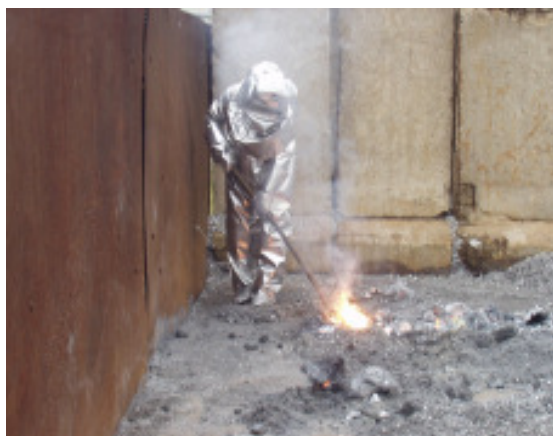
Einsatz unter Wärmestrahlschutzanzug

Bei Verladearbeiten von Aluminiumspänen in einen Absatzcontainer kam es zu einer Verpuffung, dabei erlitt ein Arbeiter schwere Brandverletzungen. In der Spänebox in der das Aluminium lagerte, hatte sich unbemerkt ein Metallbrand entwickelt. Der Arbeiter erlitt am gesamten Körper lokale Verbrennungen 2. bis 3. Grades.