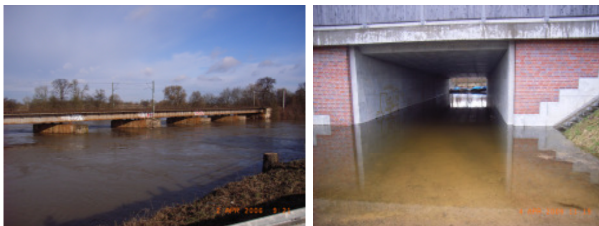
Bilder Hochwasser 2006

Diese Vermutungen wurden letztendlich auch bestätigt. Bei dem Frühjahrshochwasser 2006 handelte es sich um das zweithöchste Hochwasser der letzten 100 Jahre. Die Elbe erreichte am 03. April einen Höchststand von 6,53 Meter (2002 = 7,16 m). Bei der Mulde lag der Höchststand am gleichen Tag bei 5,10 Meter (2002 = 6,15 m). Diese sehr hohen Wasserstände führten aber zu keinen nennenswerten Schäden. Das ist zum einen auf die mittlerweile gut ausgebauten Hochwasserschutzanlagen zurückzuführen. Andererseits hat sich der Einsatz der Wasserwehr Dessau bewährt. Durch die Wasserwehren wurden ab der Alarmstufe I zahlreiche Kontrollen durchgeführt und aufgetretene Schäden frühzeitig erkannt und gemeldet, so dass auf die Schadensbilder rechtzeitig reagiert werden konnte.